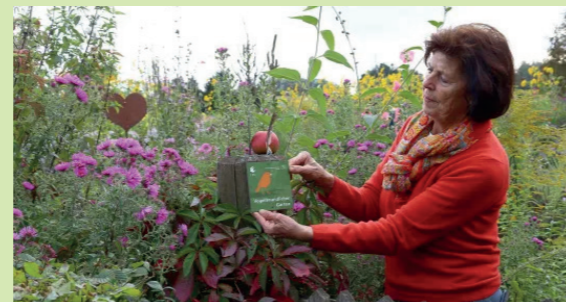
Ein ausgezeichnete Garten für Vögel

Weitere Infos unter: garten@lbv.de oder www.vogelfreundlichergarten.de